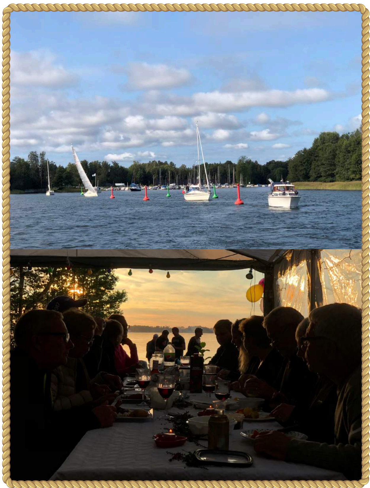
Bilder från årets eskader