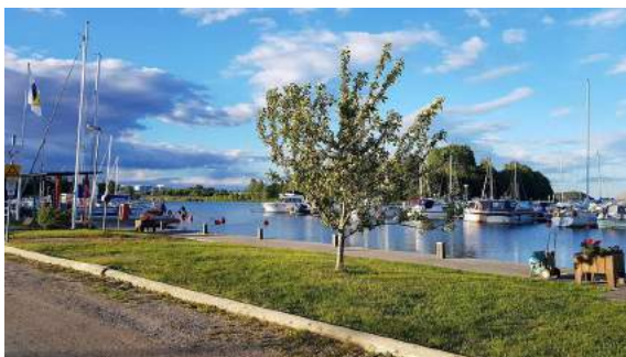
Vår vackra båtklubb!

Mitt i allt har det väl inte undgått någon att vi behöver fler funktionärer i styrelsen och kommittéerna!