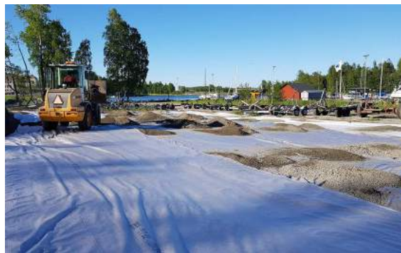
Grusning av västra området