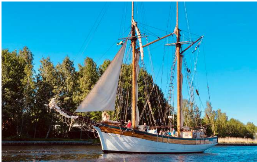
Galeasen Albanus på besök i Söderhamn.