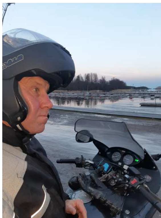
Vy över båtklubben jan-20