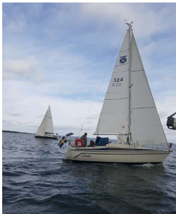
På väg till Segelvik