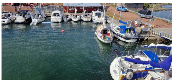
Sottunga gästhamn, härifrån kan man beskåda finlandsfärjorna

Vi startade seglingen söderut på onsdag förmiddag i dem sista resterna av dåligt väder. Vill minnas att det blev en liten regnskur men det var nog den enda på hela semestern tror jag... Någon stannade till på Jurmo, någon gjorde ett kortare stopp på Torsholma men de flesta samlades åter i Lappohamn framåt kvällen. Redan torsdag förmiddag drog vi åter vidare, en härlig skärgårds segling genom Ålands norra skärgård för att sedan kunna samlas allihop i Sottunga. Ålands minsta kommun som har en fin liten hamn längst söderut.