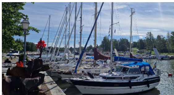
Nystad (Uusikaupunki), ganska långt in i kanalen

Det blev en ganska rejäl eskader i år. Vi blev till slut 5 st. båtar som kom iväg till Nystad. Sorgligt nog fick eskaderledaren hoppa av i sista stund men var ändå med på lördagsmorgonen då vi samlades i klubbhuset för en sista genomgång innan avfärd. Vi kände oss alla redo och kastade strax därefter loss i en nordlig styv bris vilket gav en bra vind för översegling. Det tog faktiskt bara drygt ett dygn för den snabbaste båten att ta sig över sedan droppade vi andra in i hamn med några timmars mellanrum. Vi var väl alla lite olika slitna efter överseglingen men en del av gänget besökte en restaurang.