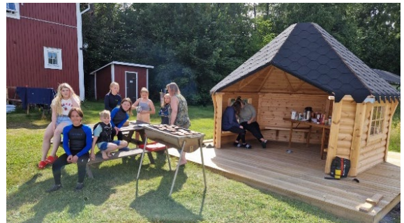
Jolleseglarna vid den nya grillkåtan

Vi hade påbörjat monteringen av grillkåtan också. Det hade gått lite trögt att få folk att hjälpa till men under hösten så blev den äntligen klar med grillplats och allt. Tror inte någon på riktigt invigt den med grill och samkväm men vi hade faktiskt en liten smygpremiär med jolleseglarna.