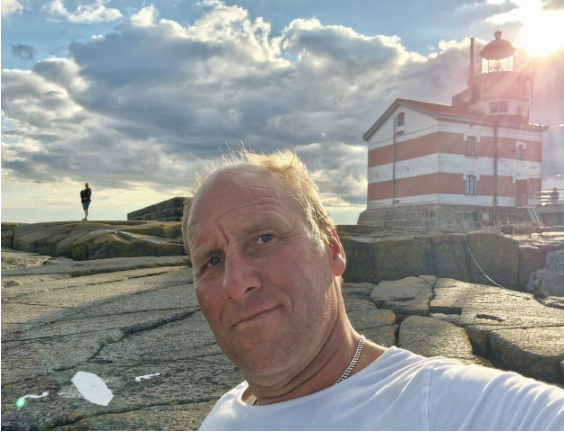
Märkets fyr, Finska Svenska gränsen