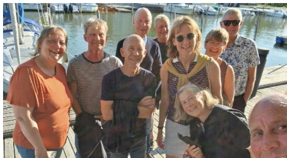
Restaurang besök på G

I övrigt blev det en ganska lugn söndagskväll för samtliga tror jag.