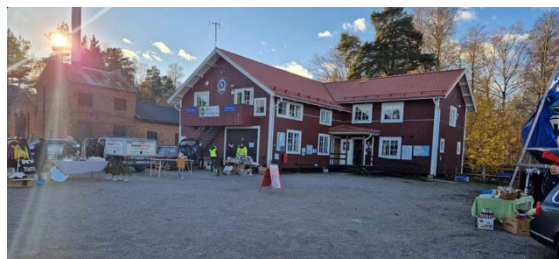
Loppmarknad på SBK

Men innan upptagning så kom 5 st. segelbåtar faktiskt iväg på en eskadersegling till Nystad i Finland. Det är en gammal tradition som klubben senast genomförde för 25 år sedan, mer om det lite senare.