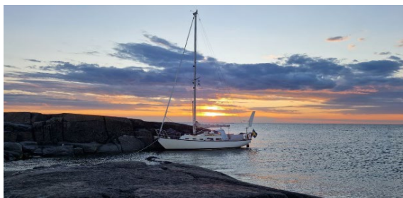
Förtöjning med bredsida, går bara vid någotsånär lätta vindar