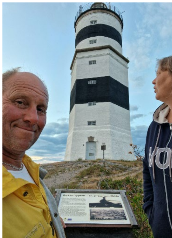
Fyrvandring på ön Örskär

Det gick inte att ankra här för det var väldigt djupt direkt bakom båten. Övernattningen gick bra och dagen efter fortsatte vi mot Örskär där skärgårdsstiftelsen har en brygga på sydsidan. Dock kommer man inte fram till bryggan med båt djupare än 1.5m.