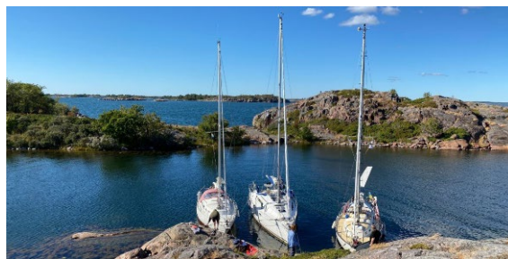
Kårdiskan, Björkörs skärgård

Vi letade oss in till Kårdiskan, en jättefin väl skyddad vik, varmt och skönt och alla badade!