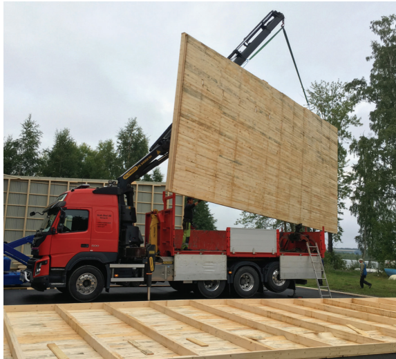
Resning av väggar till Båthall 3