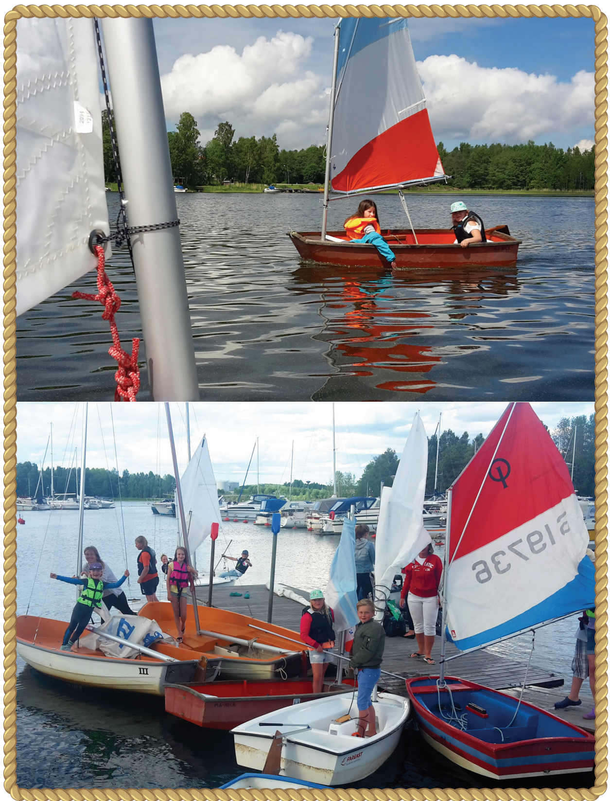
Bilder från årets jollesegling