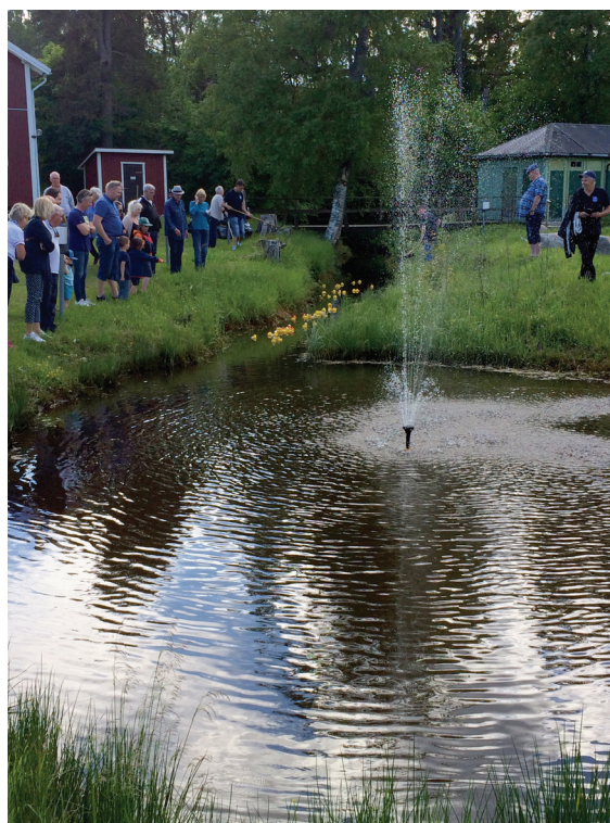
Ankrace vid 60 års firandet