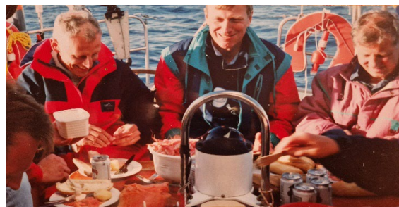
Räkfest några timmar ut från Lysekil

Vill minnas att det var fint väder när vi lämnade hamn och fått upp alla segel, väl ute på fritt vatten dukades det nämligen upp till räkfest.