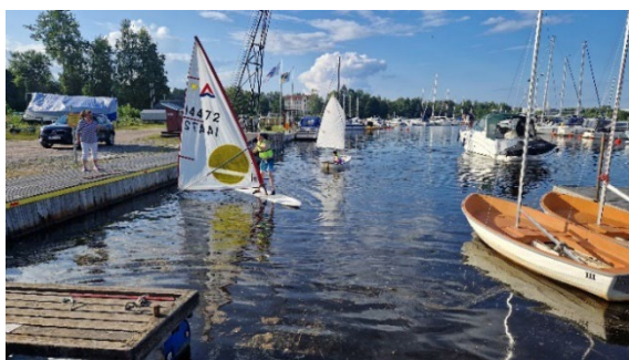
Vindsurfing vid årets jollesegling

Vi har även i år bedrivit jollesegling. Detta genomfördes med en undervisning under en helg i juli med nästan 20 barn / ungdomar. Tanken i år var att få med lite nya ungdomsledare.