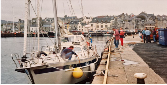
Lerwick, Shetland, juni 1994

Efter lite uppvakning kunde Mr. Tommi Duncan övertalas och efter några dygns reparation lämnade vi Shetland. Först med segelmakaren själv som skärgårds guide, därefter ut på fritt vatten! Seglingen gick vidare mot Island först via Färöarna, tyvärr lite korta om tid så det blev inget stopp.