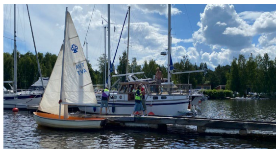
Bryggsegling, Juli 2023

Under årets jolleseglingen fick jolleledaren ett tokryck och myntade därmed begreppet bryggsegling "på riktigt", Detta då en alldeles för tung bryggsektion skulle bogseras med en Askeladden! Det gick så-där men den kom till slut på tänkt plats, detta med lite hjälp.