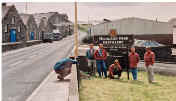
Highland Park Whisky

Från Hemön hissade vi åter segel för nästa mål, Kirkwall på Orkney öarna norr om Skottland. Återigen sightseeing med bl.a. St. Magnus katedralen och inte minst Highland Park whiskydestilleri!