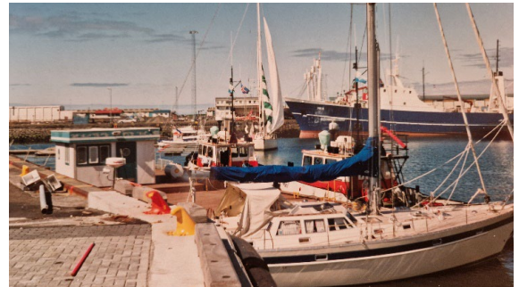
Reykjavik, juni 1994

Sedan vidare runt sydvästra udden och in till Reykjavik, där vi blev anvisade en båtplats.