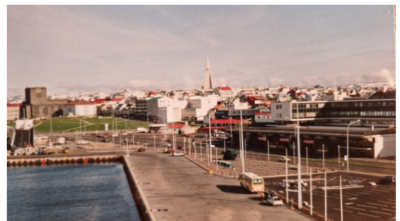
Reykjavik med berömt landmärke i bakgrunden

För min del blev det sedan lite reparationer och fix med båtkylen som hade gått sönder typ halv vägs på vår resa. Det fanns även lite annat att ordna med men fick även till lite tid för naturupplevelser och en stads tur.