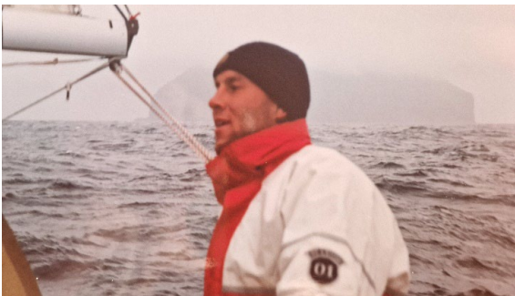
Suduroyarfjordur, Litla dimun i bakgrunden